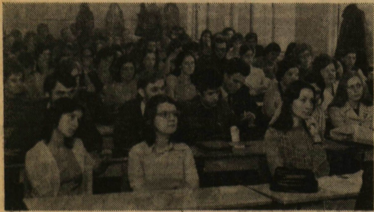
A Bölcsészettudományi Kar küldöttgyűlésén figyelmesen hallgatták a beszámolókat az időszerű munkák összefoglalását