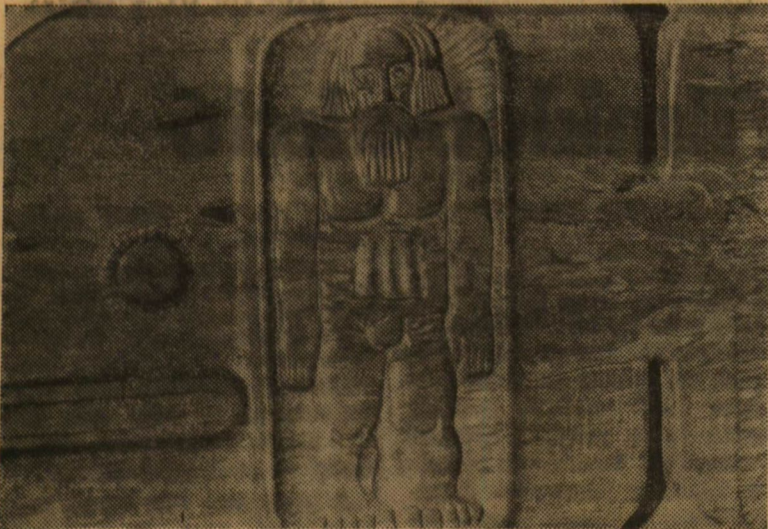
Szabó Imre: Jónás