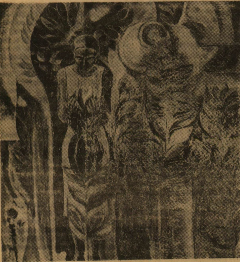
Dér István: Őszi virágok között