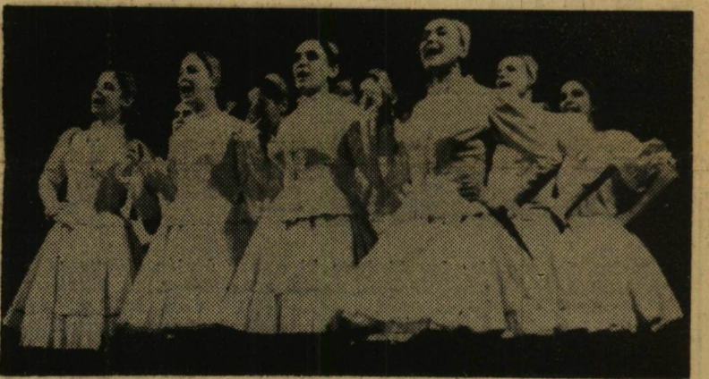
Tudományegyetemünk népi tánc együttese szép sikerrel szerepelt a Felsőoktatási Intézmények Országos Főiskolai Fesztiválján Ezerben, produkciójáért ezüst oklevéllel tüntette ki a zsüri a csoportot.

Lezajlott a IV. Egyetemi és Főiskolai Színjátszó Fesztivál. Ez volt a harmadik alkalom, amikor városunkban, egyetemünkön rendezték a diákszínjátszók találkozóját. Ezt a két évenként megrendezésre kerülő rangos eseményt már valószínűleg véglegesen Szegeden tartják. Az idei fesztivál tapasztalatairól, tanulságairól már a majdnem országos rendezvény érdekében is kérdezősködtünk.