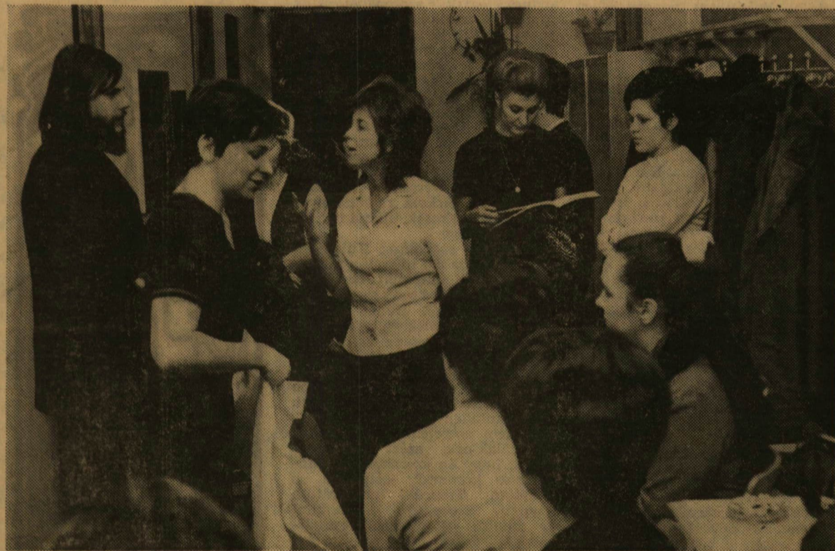
De nem ők...