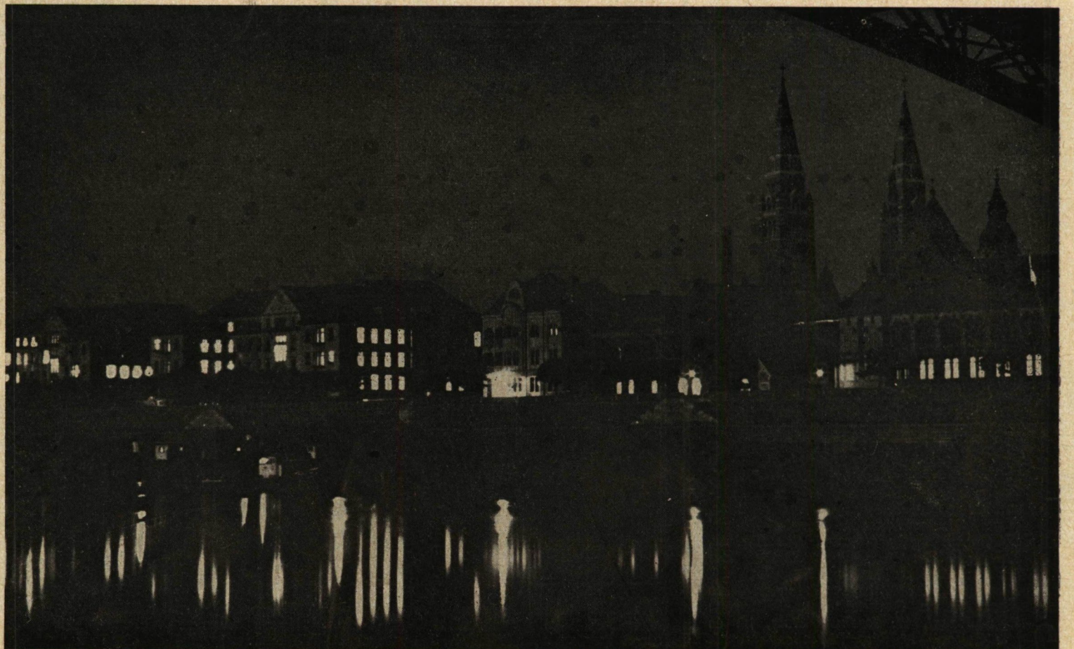
A KIVILÁGÍTOTT KLINIKASOR