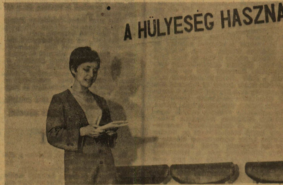
Képünkön még csak próbálnak a Felsőfokú Pénzügyi és Számviteli Főiskola színjátszói.