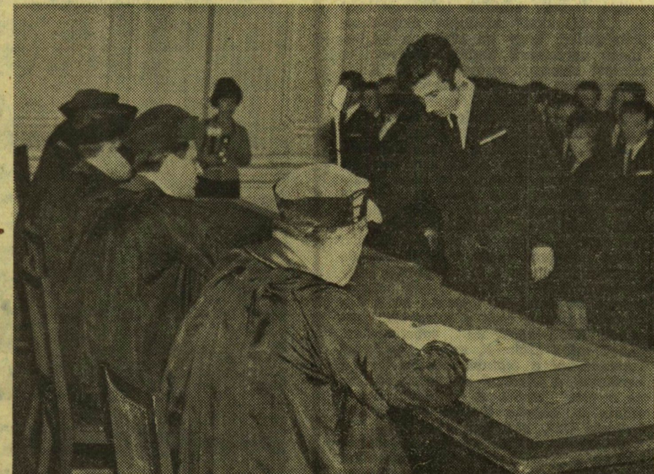
DOKTORAVATÁS. Március 21-én az egyetemek központi épületének aulájában a József Attila Tudományegyetem Tanácsa fogadott doktortá hetvenhét végzett jogászt, valamint a Bölcsészettudományi Kar, és a Természettudományi Kar tíz korábban végzett, s egyetemi doktori vizsgát tett hallgatóját.

Végül megjegyezték: a jelenlévő felsőoktatási intézmények képviselői helyteltették, hogy ezen a fontos tanácskozáson a Művelődésügyi Minisztérium képviselője nem jelent meg, jóllehet jelenléte nagyban hozzájárulhatott volna a tanácskozás és ezzel együtt az új ösztöndíjrendszer általános bevezetésének a sikeréhez.