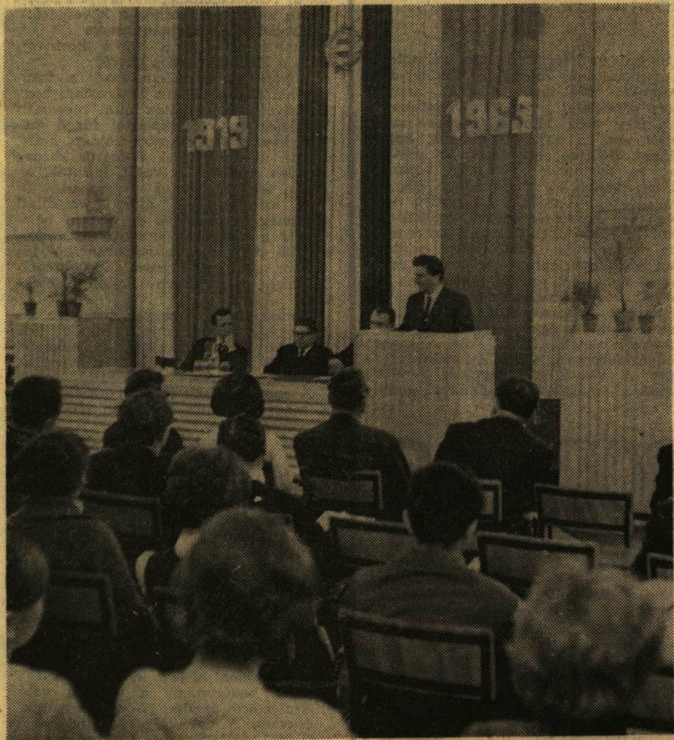
Öt országból érkeztek vendégek a Szegedi Tanárképző Főiskola ünnepi történettudományi ülészakára, amelyet a Magyar Tanácsköztársaság kikiáltásának 50. évfordulója alkalmából rendeztek meg. Az ülészakon számos külföldi résztvevő előadást is tartott

A főiskolai nemzetközi történettudományi ülészakról részletes beszámolót közlünk lapunk harmadik oldalán.