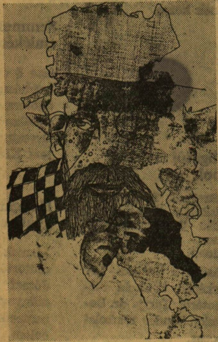
OREGEMBER Panner László rajza

Előző számunkban hírt adtunk arról, hogy a Szegedi Nemzeti Színház vezetői, művészei „fehér asztal” mellett vitatták meg a két fontos művelődési centrum kapcsolatának, jó viszonyának erősítését, a színháznak a közönség-érdeklődés növelésére tett erőfeszítéseit s annak lehetőségeit, hogy a