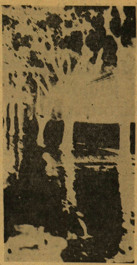
ESŐ ÉS FÉNYEK

A Kiss Ferenc Erdészeti Technikum, a Szabó János Könyvüipari Technikum, az Iparitanuló-intézet kollégiumai, valamint az Ady kollégium örömmel fogadtak bennünket. Igaz, hogy kapcsolatunk szakmai jellegű, de úgy érezzük, mindannyiunk számára hasznos. Mi előzetes pedagógiai tapasztalatokra tesszünk szert, a kollégiumokban pedig