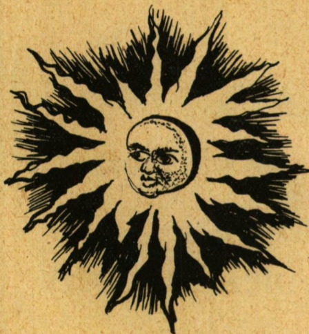
Várszegi Tamás rajzai