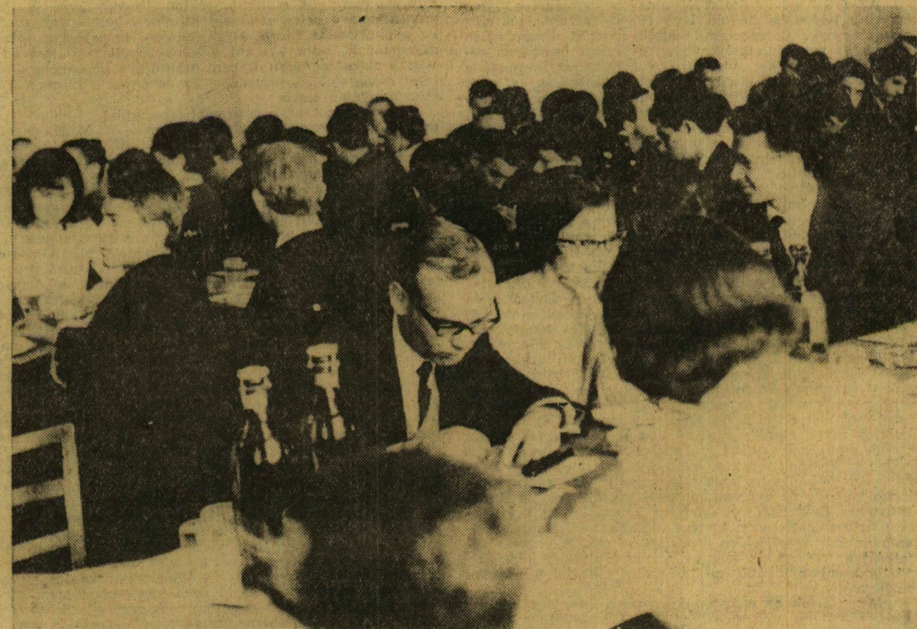
A résztvevők érdeklődéssel hallgatták a nemzetközi diák kapcsolatokról szóló referátumokat és a hozzászólásokat.