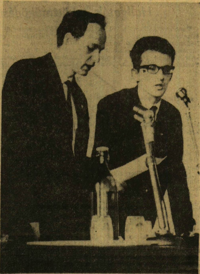
A Komszomol nevében köszöntötte a magyar egyetemistákat Vasizilij Durgenyec, a Komszomol K. B. osztályvezetőhelyettese.

jet egyetemek fejlődéséről, az ifjúsági mozgalomról, a diákság életéről, munkájáról. Elmondta, hogy a Szovjetunió lakosságának harminkét százaléka rendelkezik közép és felsőfokú végzettséggel, és ez az arány évről-évre javul azazal is, hogy egyre többen léphetik át az egyetemek és főiskolák küszöbét. Kiválasztásukban ajánlásával felelősségteljes szerepet tölt be a Komszomol. Különösen az utóbbi időben foglalkozik behatósabban az egyetemre készülő fiatalokkal az ifjúsági szervezet: előkészítő tanfolyamokkal, konzultációkkal a munkás és parasztfiatalok segítségére. Az egyetemi évek alatt nemcsak jól működő bizottságokat és diákközpontokat — ez utóbbi bizony nekünk elég furcsán hangzik — hoz létre, de az egyetemi hallgatók üzemi munkájával kapcsolatban éppen az utóbbi időben tett értékes javaslataira a Szovjetunió Minisztertanácsa is határozatokkal reagált.