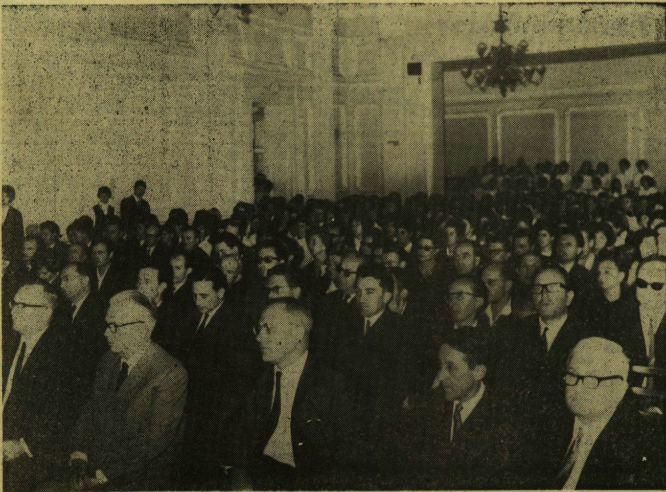
A József Attila Tudományegyetem tanévnyitói ünnepi közgyűlésének résztvevői a Dugonics téri aulában.