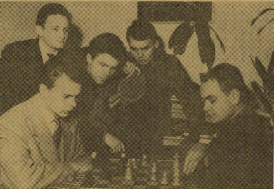
S a délelőtti-délutáni előadások, meg az esténkénti tanulás után direkt jölesik ki-kapcsolódásként pingpongozni, vagy, mint képzünk mutatja, akár egy izgalmas sakkpartit végigkibicelni is.

Képzünk: egy szobaközösség a kollégiumból — esti tanulás közben.