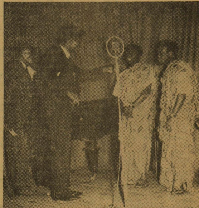
A Népek Barátsága Est egyik vidám jelenete. Afrikai diákok tréfás feleletétje arról, hogy látják-ők Magyarországot, magyar diáktársaikat — afrikai szemmel.