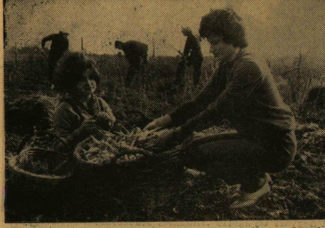
Az első termés a földéről. Két csinos leány gyűjti kosárába a földszedett zöldseget.

Csoportokra oszolva tevékenykednek a Szegedi Tanárképző Főiskola mezőgazdasági ismeretek és gyakorlatok tanszékének hallgatói Újszegeden most kialakuló gazdaságukban. Az egyik helyen tisztogatók az építkezésekhez a téglát, egy kicsit távolabb a parcellákat jelölik ki, mások a méhkaptárak körül szorgoskodnak. A tervekről, az új telep kialakításáról Pálfi György tanárkezelővel beszélgetünk.