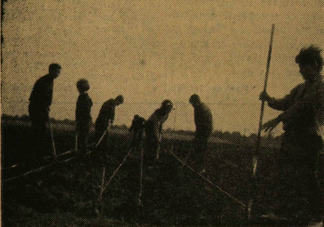
Zsinórokkal jelölik ki a parcellák helyét a mezőgazdasági ismeretek és gyakorlatok tanszékének hallgatói az újszegedi gazdaságban.