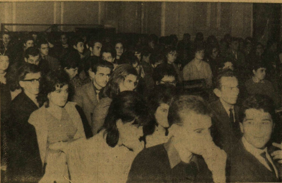
A tájékoztató hallgatói az aulában.

Néhány kérdés érintette a KISZ külpolitikai munkájának problémáit, a külföldi utazások során felmerült tapasztalatokat. Voltak, akik azt kifogásolták, hogy míg nyugati országokba igen sok utazási lehetőséget biztosít az Express Utazási Iroda addig nem eléggé intenzív és széles körű a testvéri szocialista országokba, elsősorban a Szovjetunióba való utaztatás. A kérdések egy része a vietnami háborúval, az indonéziai válság körülményeivel, Kína szocialista tábor többi országai viszonyával s más aktuális külpolitikai témákkal foglalkozott.