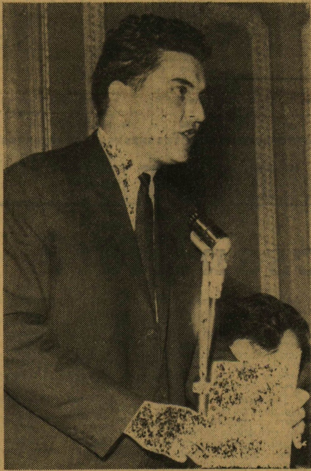
Nádasdi József megtartja tájékoztatóját

A közelmúltban a Csong-megyei KISZ-bizottság, valamint a három felsőoktatási intézmény KISZ-bizottságai meghívására Szegeden jár Nádasdi József a KISZ Központi Bizottsága titkára. A Dugonics téri központi épület aulájában Nádasdi elvtárs igen érdekes tájékoztatót tartott, az előzőleg hozza eljuttatott kérdésekre válaszolva. Részletesen foglalkozott az Országos Diákszövetség és a Magyar Ifjúság országos Tanácsa tevékenységével, beszélt azokról a szélesedő kapcsolatokról, amelyek a magyar ifjúság és a világ országainak demokratikus érzelmű, haladó gondolkodású fiataljai között szövődnek.