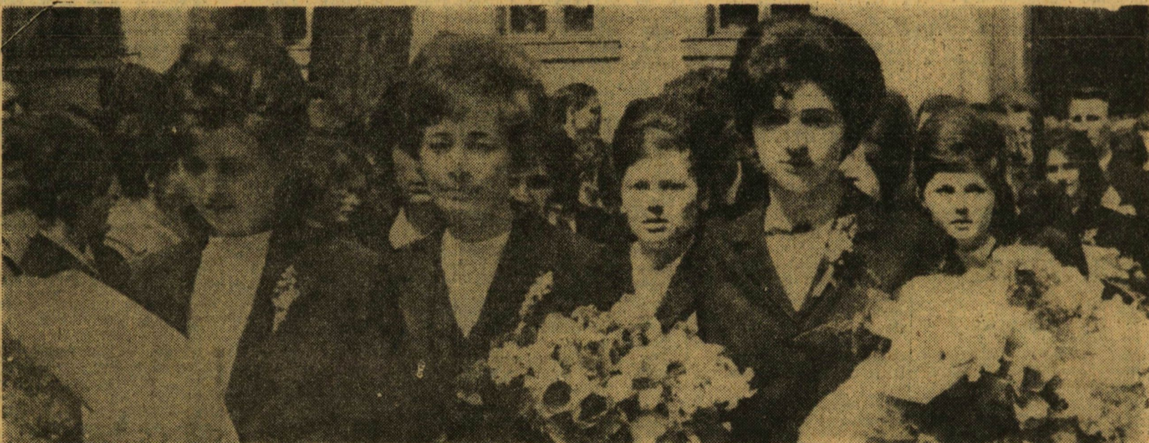
A Szegedi Tanárképző Főiskola végzős hallgatóinak ballagása május 8-án. Hozzátarozók, napsütés, virágok, itt-ott talán könnyes szemek is. Az élet szöli... Vége a gondtalan diákoskodásnak.