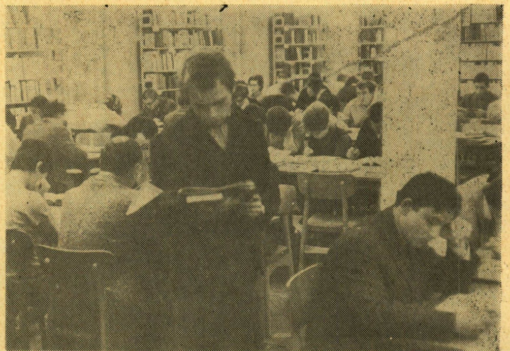
Húsz év telt el azóta. Ma modern olvasóterem, folyóiratolvasó kutatószoba, mikrofilmolvasó berendezések fogadják a tudnivágyókat, a könyvek szerelmeit. Akik száma évről évre növekszik. Nagy a forgalom az Egyetemi Könyvtár olvasótermében.

tagjai igyekezettel oldották meg feladatukat, de nem mindig komoly felkészültséggel.