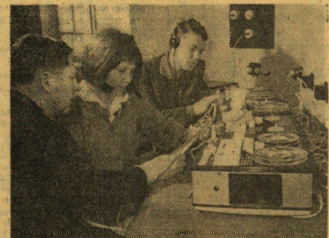
Készül a tananyag a stúdióban