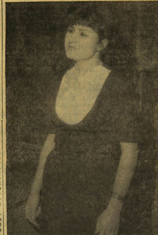
A tudományegyetemi szavalóverseny egyik győztese.