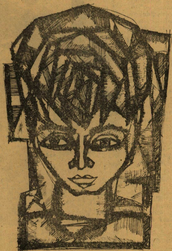
(Szent Ernő rajza)