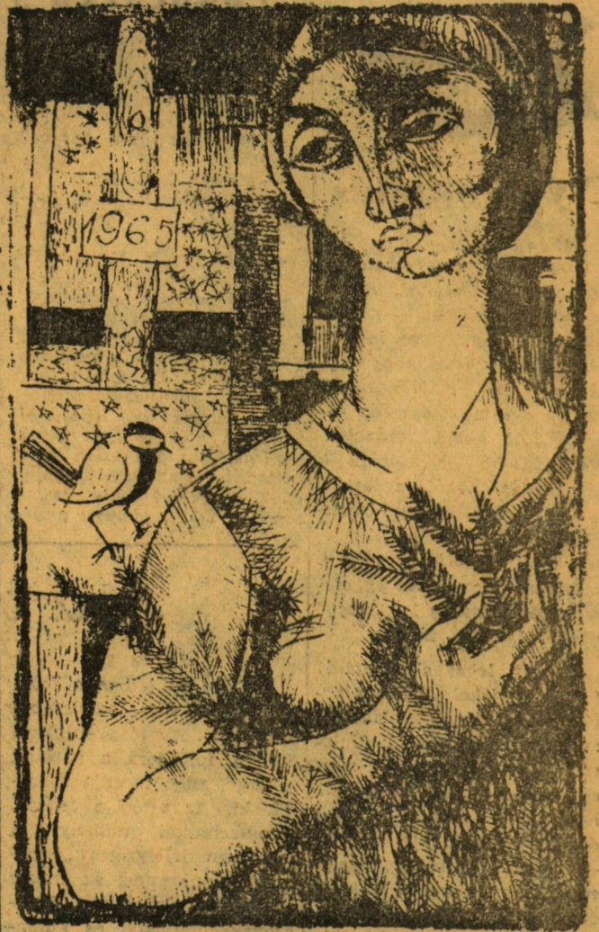
CZINKE FERENC RAJZA