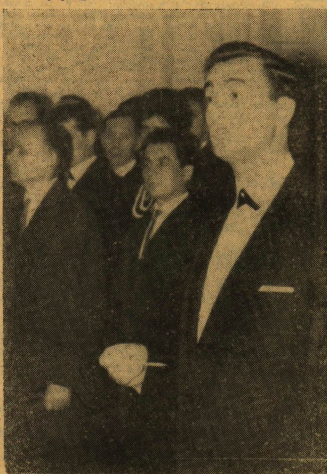
A doktori cím új birtokosainak egy csoportja.