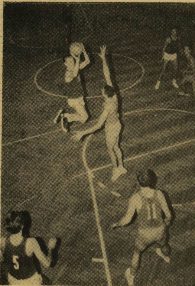
Szegedi támadás a vendégek kosara ellen

A mai vezetés problémái ismertebbé válnának az ifjúság köreiben, s ez egy sor léves értesülést szétfoszlatna. Furcsa persze az, hogy a legtermészetesebb dolgot csupán kérjük, hogy tudniillik: egyetemistákat is vegyenek be a sportkör vezetésébe.