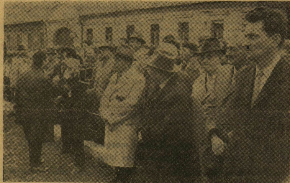
A leleplezési ünnepségen megjelent egyetemi oktatók és hallgatók, valamint más érdeklődők, József Attila költészetének kedvelői Köpeczi Béla beszédét hallgatják.