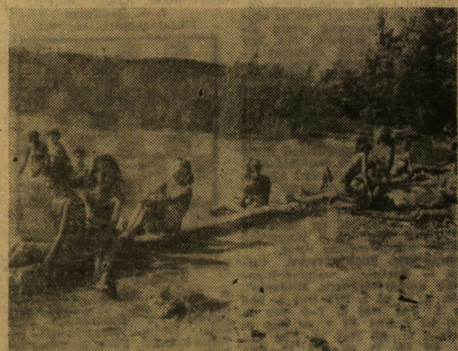
Délben befejeződött a munka. A melegtől ernyedien, s fáradtan szálltak leherautóra a lányok, s maszatatosan, „füttve” egymást és dalolva érkeztek a táborba vissza. Ebédre töltött káposztát és dinnyét terítettek. Délutánra pedig a Balatont, Nem is volt olyan rossz az éjjel Aligán.