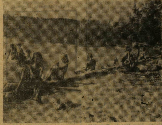
Délben befejeződött a munka. A melegtől ernyedien, s fáradtan szálltak leherautóra a lányok, s maszatosan, „füttve” egymást és dalolva érkeztek a táborba vissza. Ebédre töltött káposztát és dinnyét terítettek. Délutánra pedig a Balatont, Nem is volt olyan rossz az éllap Állag.