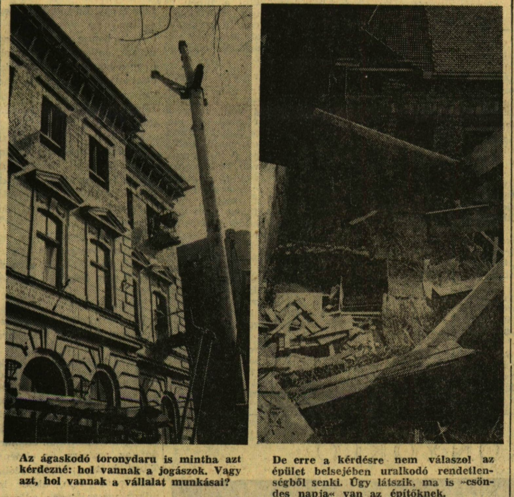
Az ágaskodó toronydarú is mintha azt kérdezné: hol vannak a jogászok. Vagy azt, hol vannak a vállalat munkásai?

Befejezésül értékelte kritikai életünk jelenségeit, hangsúlyozva, hogy minden eszközzel erősíteni kell a színvonalas marxista kritika hangját, a kritikusokat ki kell szabadítani a »lutheránuságig» menő határozatlanságból, s szerkesztőségekben kiadónál feltétlenül meg kell erősíteni a szocialista bázist. Ebben a munkában a közvélemény hangjára is számítnak.