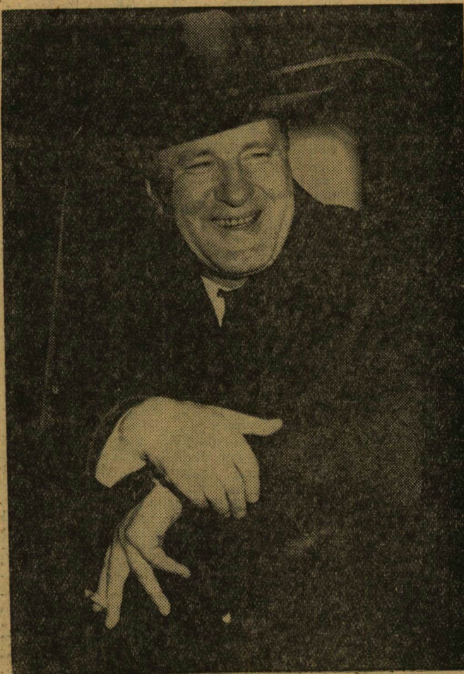
Elérkezett a búcsúzás pillanata. Kádár elvtárs mosolyogva néz ki a különvont ablakából: a viszontlátásra! Ismét Szegeden.

Reméljük, nem sokára ismét láthatjuk Szegeden Kádár elvtársat s akkor bizonyára több időt tölt majd tudományos és kulturális életünk munkái körében is.