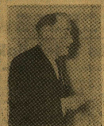
Modlinsky professzor felszólal a kollokviumon.

szemlélet követelményeinek érvényt kell szerezni. A munkajog tudományának és gyakorlatának ismerete nél-