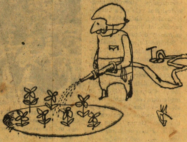
Mayer Gyula rajza