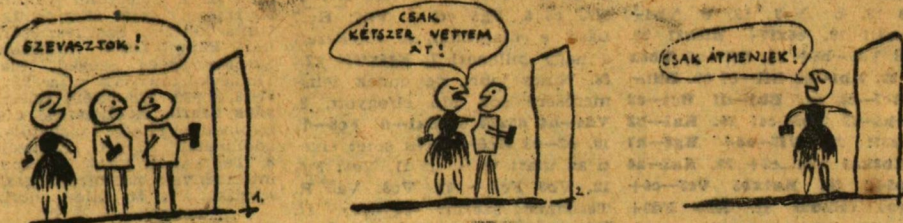
(Csányi Miklós rajza.)