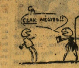
(Csányi Miklós rajza.)