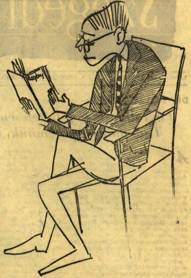
Van még csoda is! Az irodalomszakos olvas!