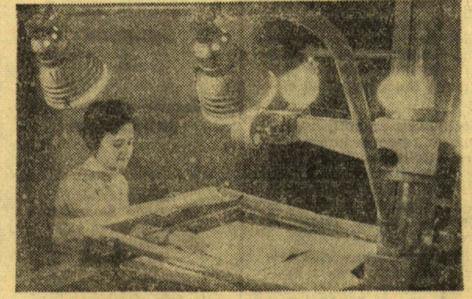
Munkában az új mikroszkopkészülék