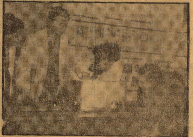
Kísérletek a Lélektani Intézetben