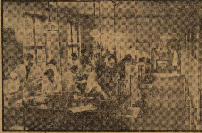
A Szerves-Kémiai Intézet laboratóriumában