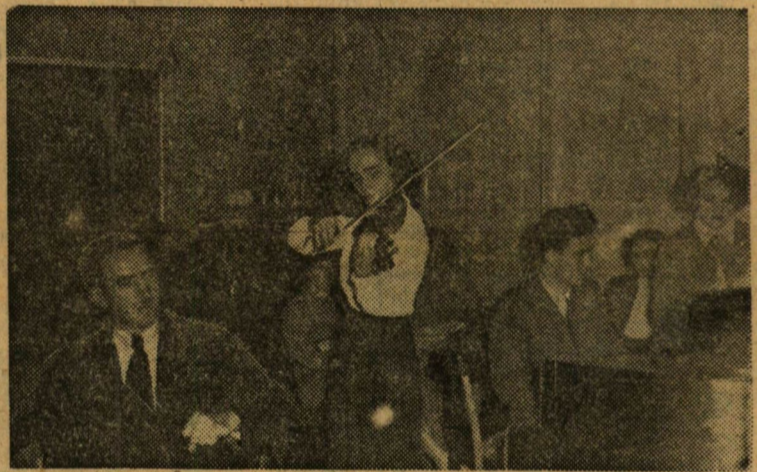
A klub megkezdte a hallgatók és dolgozók szórakoztatását,

A DISZ feladata gondoskodni arról, hogy a klub minden vonatkozásban betöltse hivatását és az egyetemi és főiskolai ifjúság benyújtandó kultúrthozzáértelmező klub célja a kulturális és szórakozási szükségletek kielégítése, műsoros táncestek rendezése, mely eszköz arra is, hogy az egyes karok hallgatói között a baráti kapcsolatokat elmélyítse. A DISZ-nek arra is fel kell hívni az ifjúság figyelmét, hogy a klub könyvtára a nyugodt