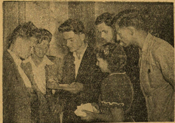
A Tudományegyetem Bolyai Intézetében a matematika-fizika szakra jelentkezettek egy csoportja beszélget a szóbeli vizsga előtt.