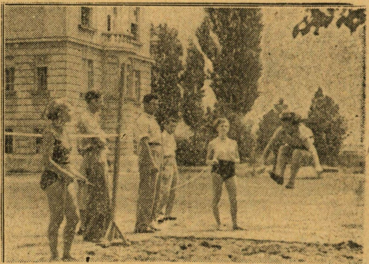
A testnevelési szakra jelentkezettek szakmai vizsgájuk közben.