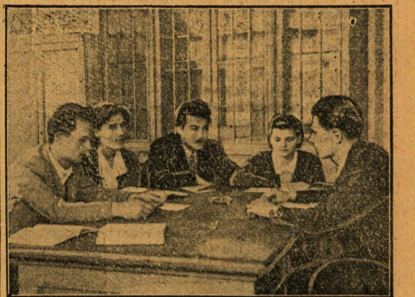
IV. éves Bölcsészhallgatók megbeszélést tartanak az államvizsgáról a Tanulmányi Osztály vezetőivel.

A marxizmus-leninizmusból folyó államvizsgák eredményei hiányosságuk ellenére is igen biztatóak, s arra engednek követ-