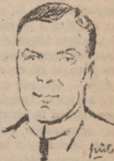
Varga Béla dr. a legnagyobb magyar bir- kózó, világbajnok.

Ezek a kemény öklü, összeszorított fogu szomorú magyarok írják meg majd az igazi békét . Trianonban a hadseregünket leszerelték, hogy ők maguk állig felfegyverkezessenek, feldarabolták az ezeréves „barbár“ Magyarországot, hogy a „kultur“ oláh, szerb és cseh szabadon fejlőd-hessék. Nekünk csak a csonka ország és a nyomoruság maradt, amelyből úgy tudunk kiszabadulni, ha a sportban erősek leszünk. „A sport a nemzetek műveltségének és erejének egyik biztos fokmérője.“ A testedzés-től nem tilthatnak el bennünket. (Az összehasonlítást láttuk.) Mi a játéktereken képezzük ki katonáinkat, mert akinek a mellén a zöld gyepen való békés küzdelemben megfeszült a meggyipiros ing kettős-keresztes cimere, annak akkor nem szorul el a szive, ha a viadal után nem fényes aranypénz, hanem egyszerű bárdolatlan fakereszt lesz a jutalma — Nagy-Magyarország visszaszerzéséért . . .