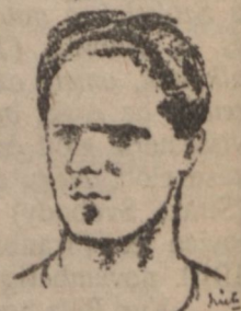
Somfay Elemér, pentatlon bajnok, hármasugró rekordér.